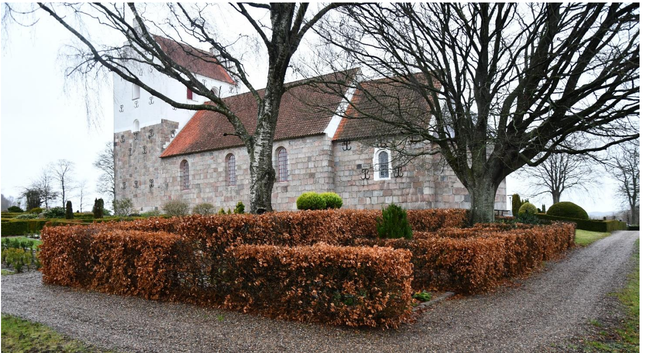
Foto 3. Blandt andre områder, kan dette gravområde overvejes til nedlukning