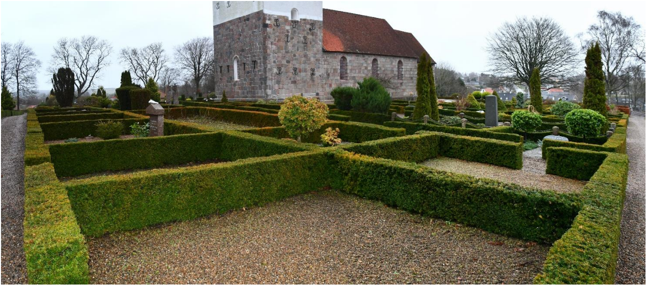
Foto 2. Del af det primære område til nedlukning, hvor der er en del ledige gravsteder