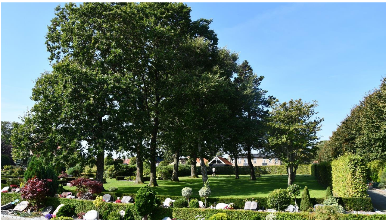
Foto 7. Trægruppe med blandede træarter

Egetræerne i området vokser med forholdsvis små afstande. De er blevet store og slanke og formet af hinandens nærvær. Nogle har skæv vækst i kronerne. Derfor bliver det ikke pænt, hvis et træ fældes for at give lys til de andre. I stedet afskæres grene for at give mere lys i trægruppen.