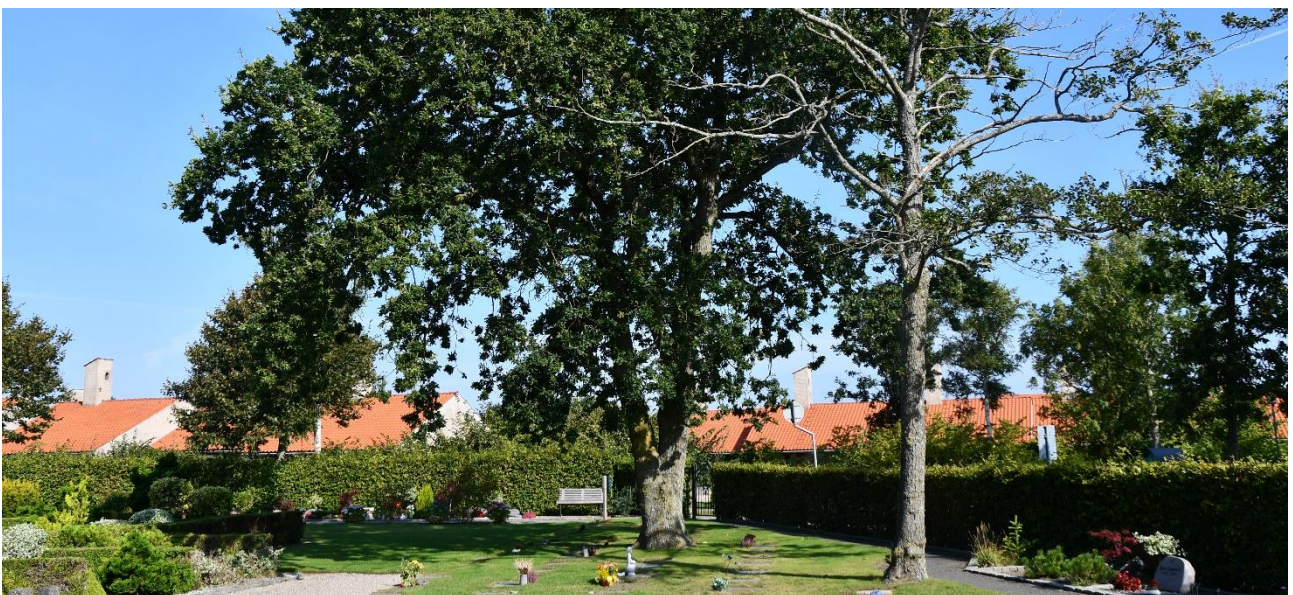
Foto 6. Næsten udgåede elletræer fældes. Nedhængende og døde grene på egetræet fjernes

Nedhængende og døde grene på et egetræ fjernes, se foto 6. Et par egetræer kan plantes i frie områder, når el er fældet.