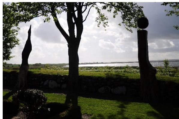
Foto 8 og 9. Inspiration til udformning af døde træer. Sønder Dråby Kirkegård