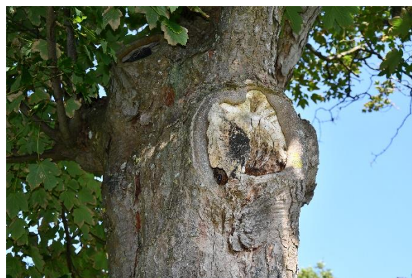
Foto 4. Råd i ahorn efter afskårne grene