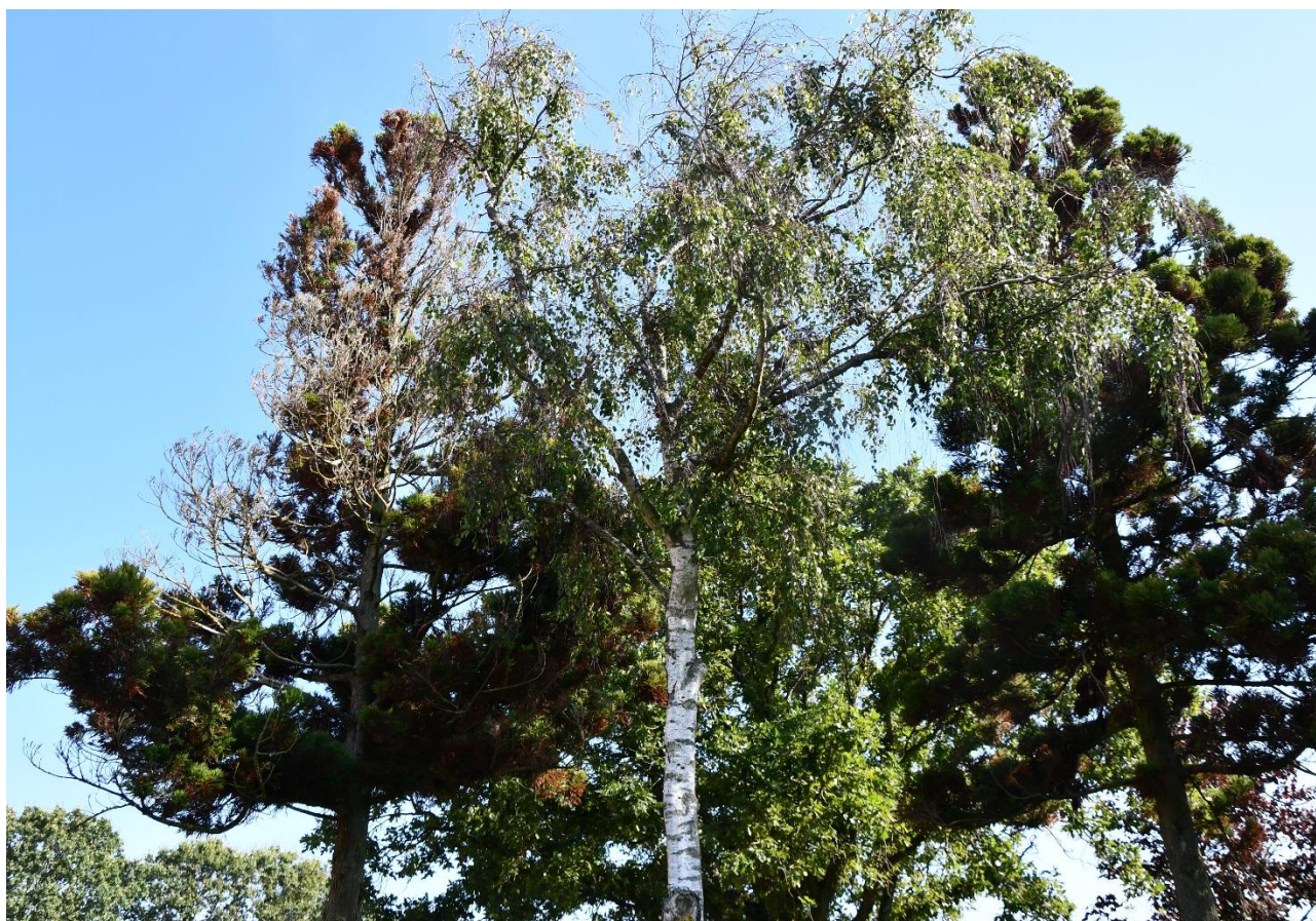
Foto 2. Et birketræ og 2 fyrretræer fældes

Et større egetræ har enkelte døde grene, der fjernes, se foto 5.