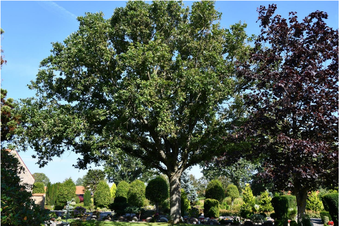
Foto 5. Døde grene fjernes fra stort egetræ.

Område 2. I området vokser flere elletræer. 2 stk. næsten udgåede elletræer fældes, se foto 6. Hvis flere elletræer bliver bladløse, bør de fældes.