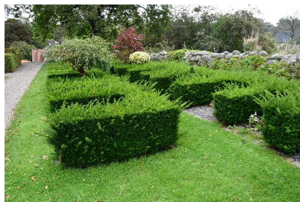
Foto 3. Nye urnegrave anlægges som eksisterende