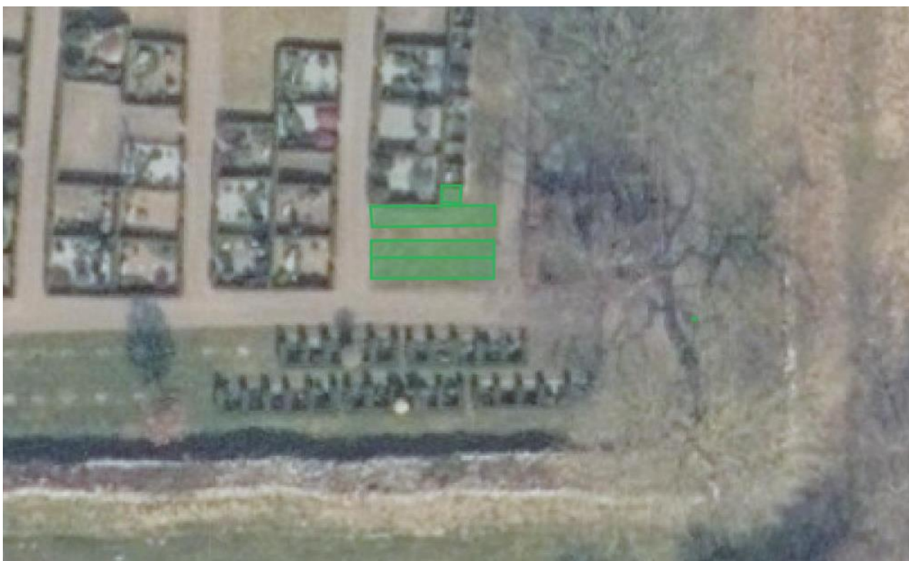
Foto 1. På kirkegårdens sydøstlige del kan der anlægges individuelle urnegrave, markeret med grøn signatur

Det anbefales desuden, at menighedsrådet får udarbejdet en udviklingsplan for hele kirkegården, som kan give langsigtede retningslinjer for kirkegårdens udvikling.