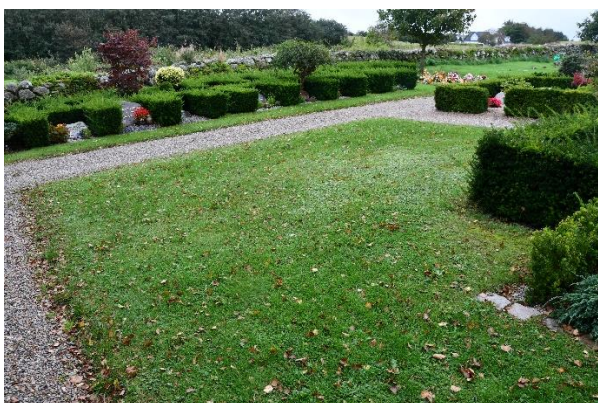
Foto 2. Ledigt plæneareal, hvor der kan anlægges ca. 16 individuelle urnegrave (1 + 5 + 5 + 5)