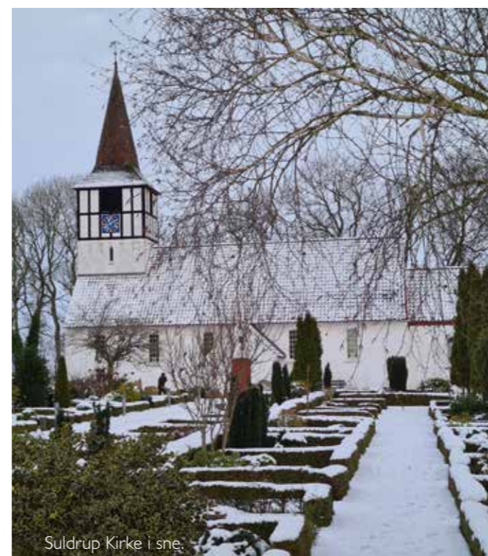
Suldrup Kirke i sne.