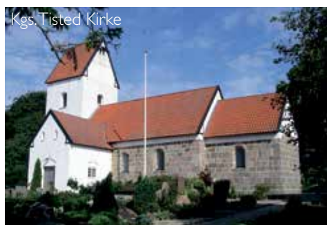
Kgs. Tisted Kirke

Børneklubben Banditterne mødes i Skrænten onsdagene 17. og 31. august