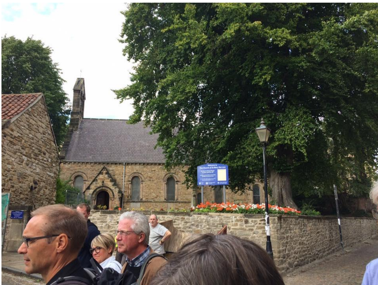
Afrunding: Mini-evensong i St. Mary's the Less. Taizé-intro, Magnificat og Nunc dimittis m.m. Teksterne fik vi lov at vente med til senere!