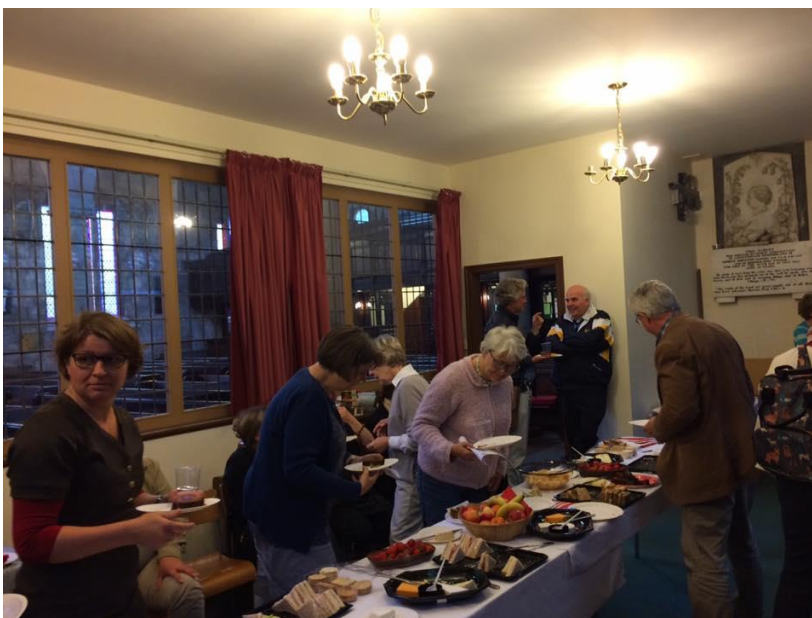
Der blev sørget godt for os.