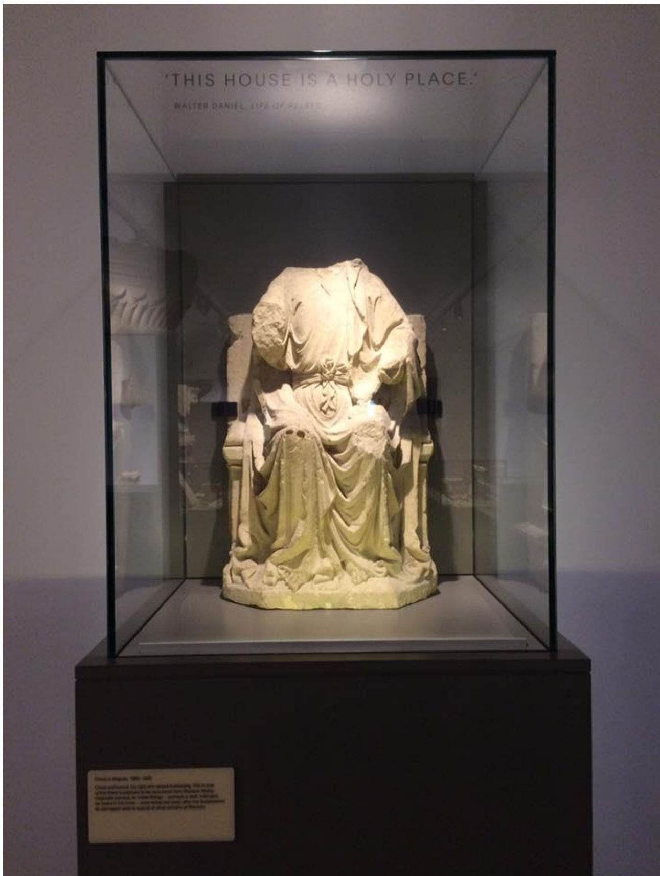
Til klosteret hører et lille fint museum. Her henledes opmærksomheden på især tre ting. For det første den nu hovedløse "Christ in Majesty" (1260-1300).