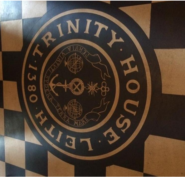
Trinity house med en stolt historie tilbage til 1300-tallet.