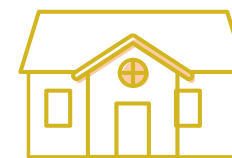
Ikke fredet bygning udenfor kirkegård

Læs mere om kirkens byggesager i vejledningen om bygninger og arealer. Find vejledningen på Den Digitale Arbejdsplads under fanen "Håndbøger" og i feltet "Bygninger og arealer".