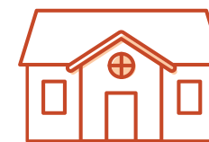
Fredet bygning udenfor kirkegård

Menighedsrådet kan selv tage stilling til en række ting, se bagsiden.